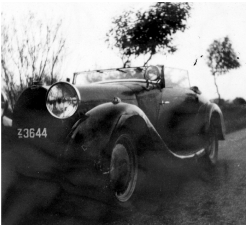
Enevold Vestergaard tog dette foto, da han i sydvestjylland i 1948 nær var blevet ejer af Pahl's gamle type 50. Nummerpladen Z 3644 viser indregistrering i det gamle Ribe Amt.

blevet stjålet - både dæk og aluminium udgjorde særlige værdier i krigsårene. Værre var det dog, at en tredjeperson havde pant i bilen, og da Scheel endnu var på laveste aspirant-løntrin i Udenrigsministeriet, havde han ikke råd til at overtage vognen.